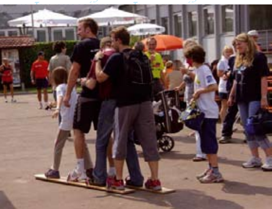
Angebot Sommerski der Skiabteilung

keit zum einem Probetraining in unserem Fitness-Studio.