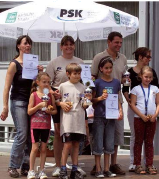
Gewinner Familien-Spaß-Hindernislauf der Leichtathletikabteilung

Die Vorführungen unserer Budo-Abteilungen wie AiKiDo, Judo und Taekwon-Do sowie JKD/FMA versetzten die Zuschauer in helle Begeisterung.