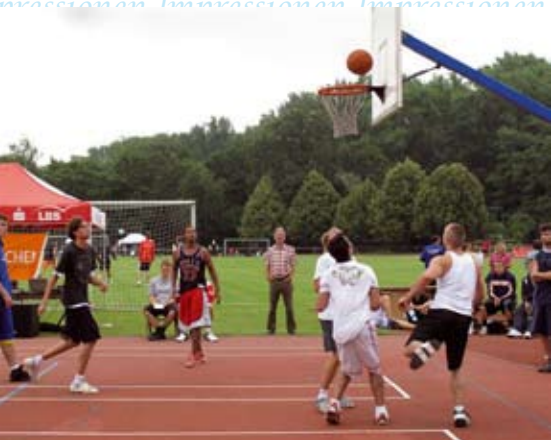
Fidelitas Streetball Challenge