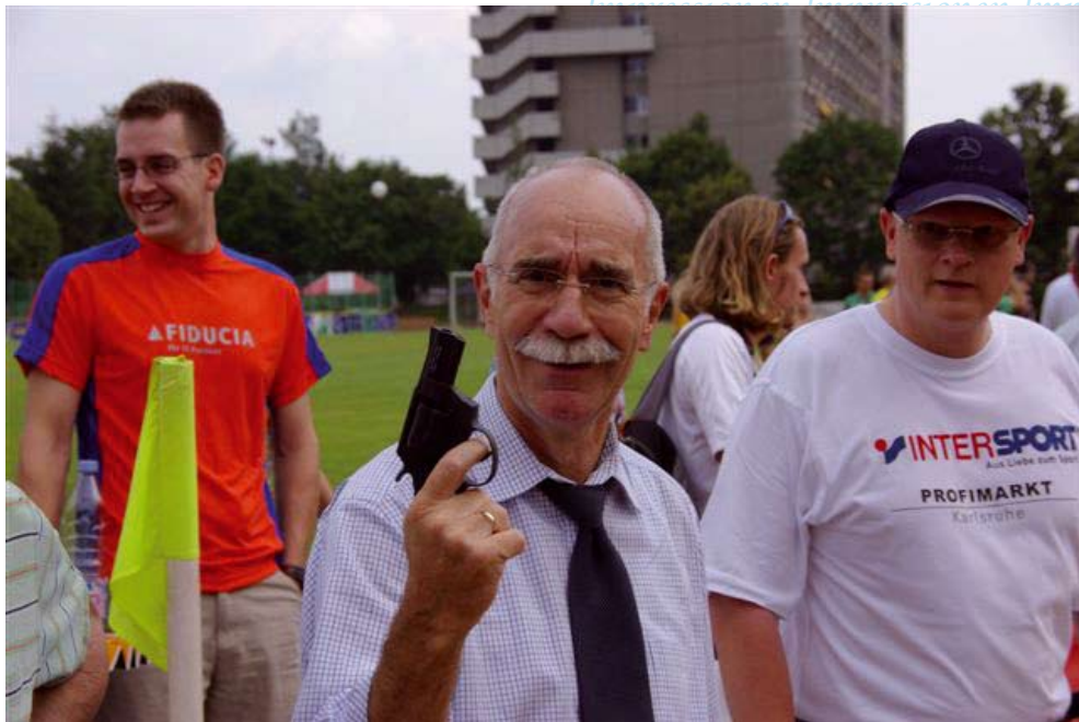
Startschuss durch Harald Denecken, 1. Bürgermeister aus Karlsruhe.